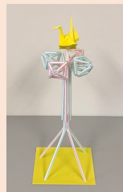
ストローゲーム完成例